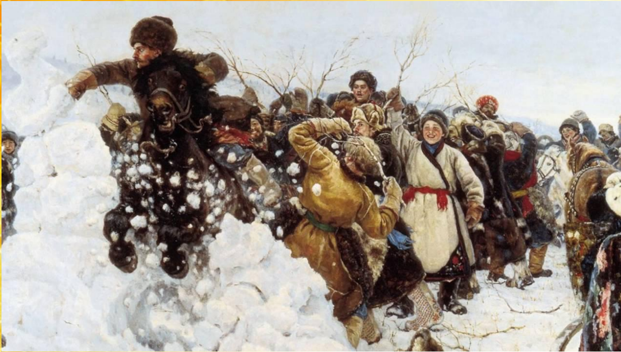
«Взятие снежного городка». В. Суриков.