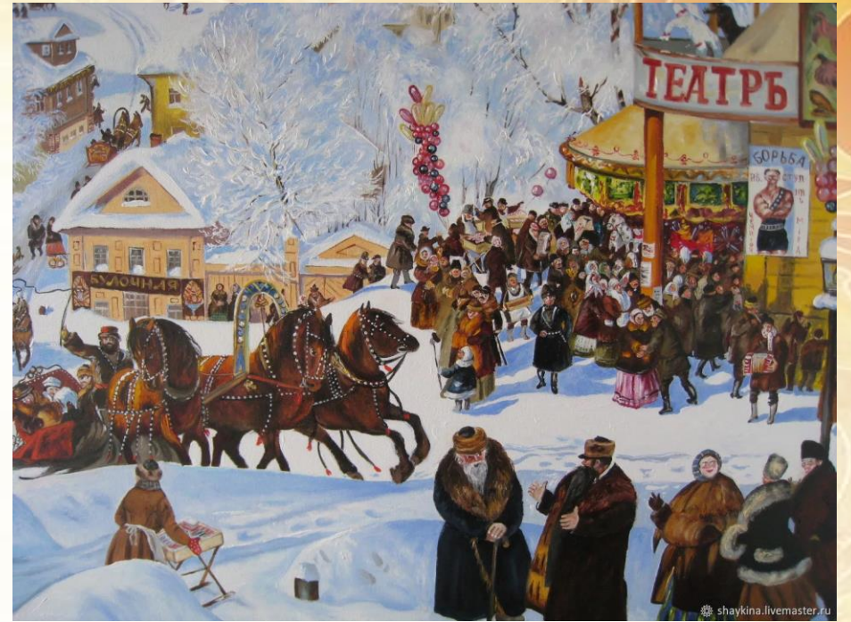
«Масленица». Б. Кустодиев.

Народ любил и любит Масленицу. Всенародная любовь к этому празднику нашла отражение в творчестве русских художников.