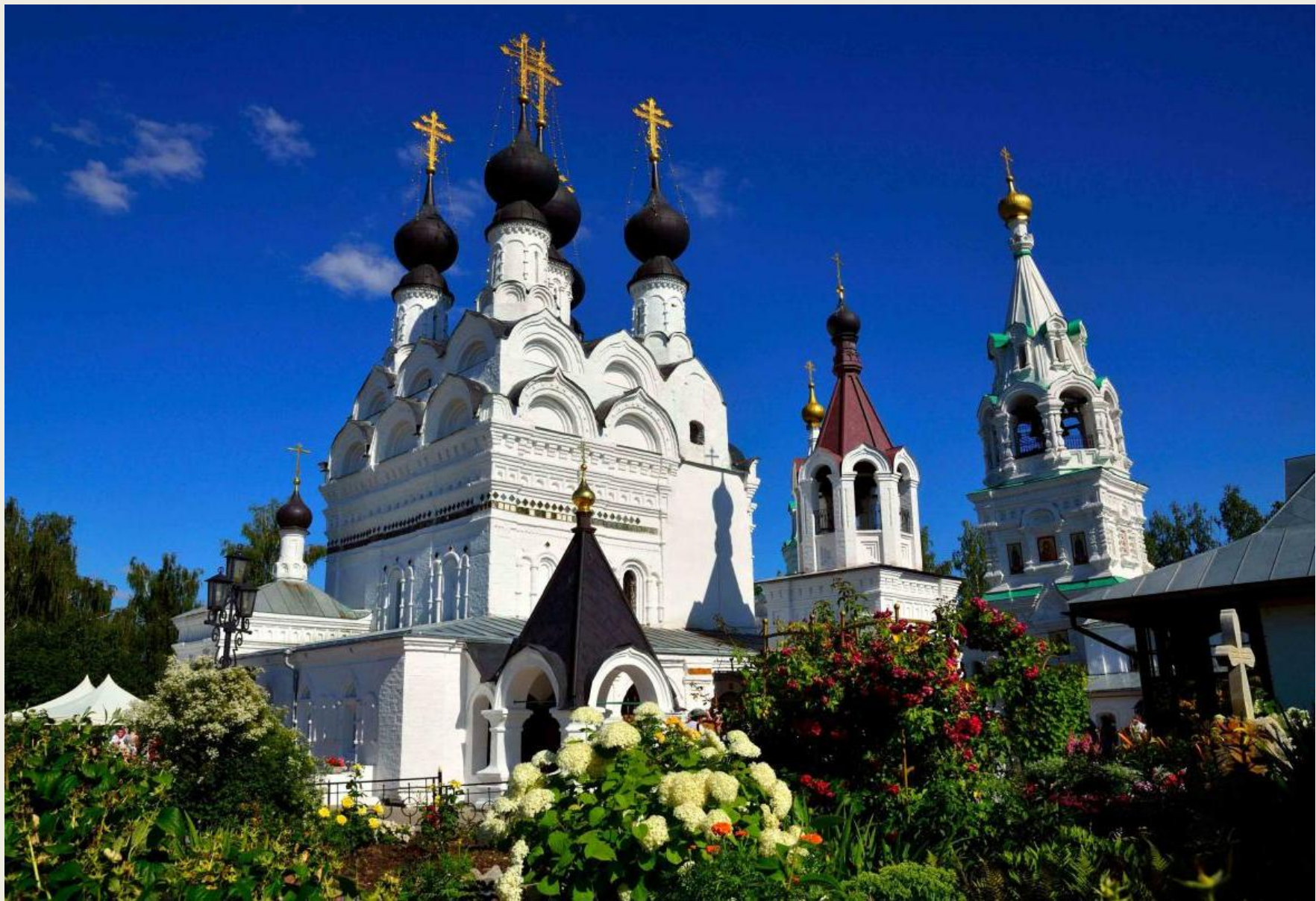
Свято-Троицкий женский монастырь в Муроме, где покоятся мощи святых Петра и Февронии .