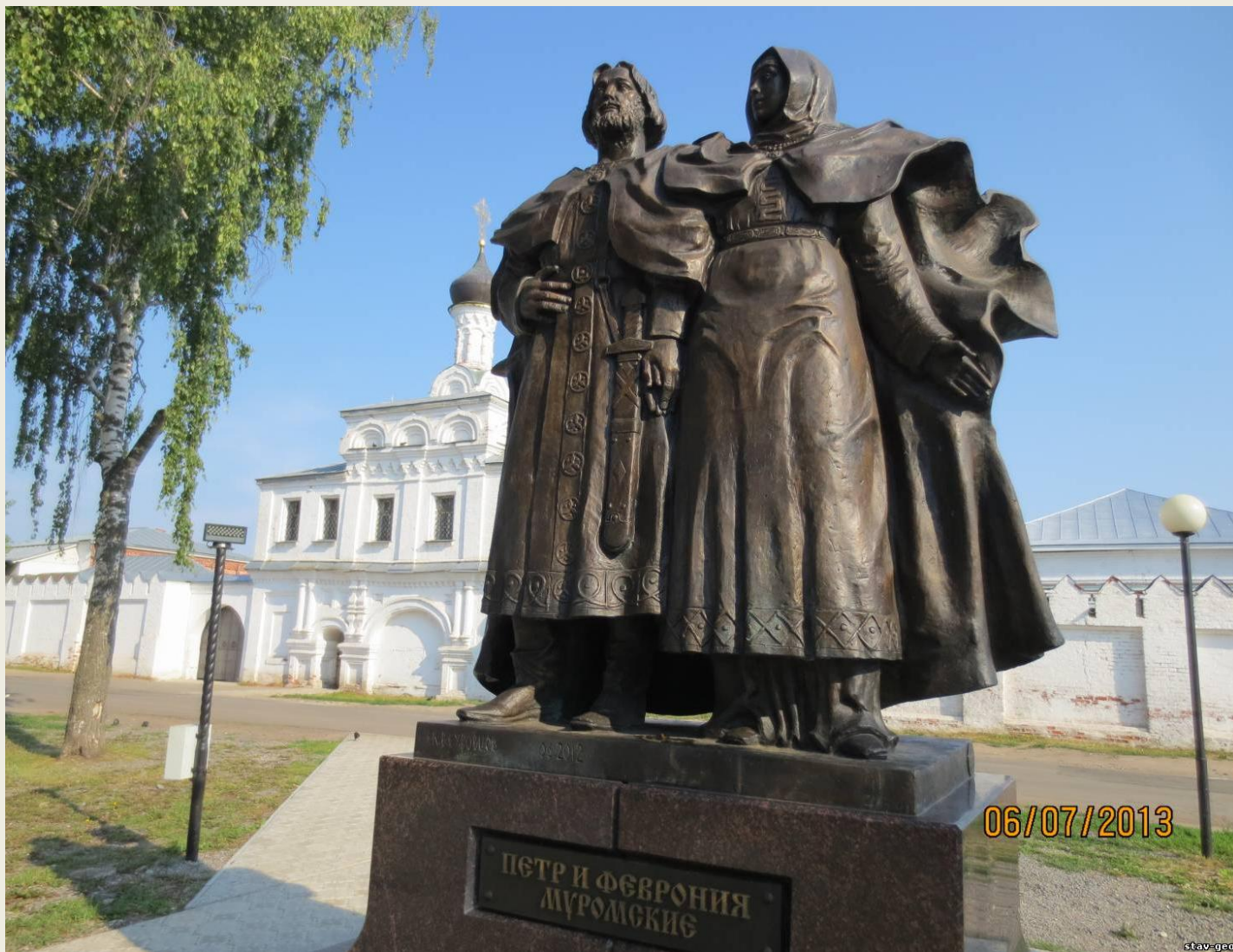
Скульптурные композиции «Святые благоверные Петр и Феврония Муромские» в городе Муроме.